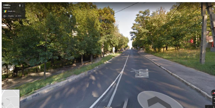
Google Streetview: útban a Jókai-kerthez

A regény elején megismerhetjük a Szent Borbála utasait, de kik a ti útitársaitok? Megtudhatjuk, hogy milyen céllal utazik Euthym és Timea, de milyen céllal utaztok ti? Az utazás során sok nehézséget kell leküzdeniük, kezdve az ellenőrzéssel, az elszabadult malommal, vagy azzal, amikor salto mortale-t hajtanak végre egy „úszó mammuttal”. A ti utazásotok is tartogat váratlan fordulatokat?