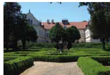
Hrad Andrásyovcov – Trebišov