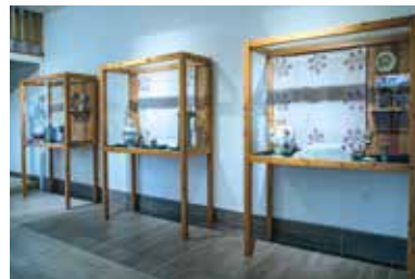
Biblia Múzeum – Gönc

Indulás előtt legalább két nappal érdemes bejelentkeznünk a múzeumba.