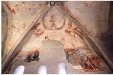
A 12. és 15. századból származó freskók – Vizsoly

A Vizsolyi Biblia eszmei és pénzben kifejezhető értékét mi sem bizonyítja jobban, mint az, hogy nemcsak a Vizsolyban őrzött példányát, de egy Zuglóban élő lelkész család tulajdonában lévő példányt is elloptak már. Szerencsére mindkét esetben sikerült megtalálni és visszaszerezni a magyar szentírásokat. Ezért tehetjük meg, hogy a helyi református templomban saját szemünkkel tanulmányozhatjuk a Biblia egyik eredeti példányát. A Biblia nemcsak egy könyv a sok közül. A kötés, a betűk formája és az intarziák mind-mind magas szintű művészi teljesítményről árulkodnak. A középkori könyvkötő iparosok kezei alól soha nem került ki két teljesen egyforma munka, így csaknem minden produktum eredetinek számít, akárcsak a nyomtatott Biblia .