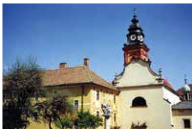
Paulínsky piaristický kostol – Sátoraljaújhely

Najkrajšou časťou Medzibodrožia je pozostatok pohoria bývalej sopky veľkosti Vežúvu, pohorie Sátoros, na úpätí ktorého sa rozprestiera krajina najviac, hlavné mesto Zemplína, rodné mesto vína Aszu, mesto mnohých iných zázrakov. Pôvodný obec bol ešte na rovinách Ronyva a Bodrog, ale séria skúšok – požiar, povodeň, tatársky vpád – čoraz viac hnala mesto na úpätie hôr v tvare stanov. Bývalé sídlo župy rozdeľuje potok Ronyva, takže východná časť mesta dnes patrí Slovensku ako Slovenské Nové Mesto. Prvé záznamy obce pochádzajú z roku 904. István V. udelil Újhelymu v roku 1261 štatút mesta. II. Ferenc Rákóczi, Ferenc Kazinczy, Lajos Kossuth, gróf Gyula Andrássy a mnohí ďalší sformovali kultúrny život a históriu mesta.