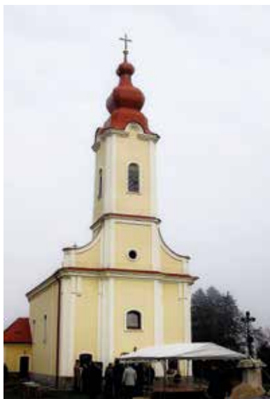
Római katolikus templom – Rad

Radról az első írásos emlék 1319-ből maradt fenn, a keresztúri határ ismertetését tartalmazó oklevélben. Bár történelme neves eseményekben nem bővelkedik, a szomszédos településekhez hasonlóan itt is állt várkastély, amely a feltevések szerint még a kuruc időkben elpusztult. Olyan sok birtokura volt a falunak, hogy számon tartani is lehetetlen volna. Az igazán tehetős főurak nem tolongtak birtoklásáért. Első látásra talán jelentéktelen kis falucskának tűnik Rad, de van valami, amiért mégis érdemes ellátogatni ide.