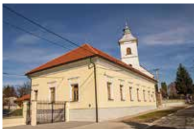
Biblia Múzeum – Gönc

A kiállítás bevezető részében az úgynevezett Károlyi-teremben , főleg helytörténeti vonatkozású műtárgyanyagot láthatunk. Továbbhaladva az Oroszországból hazaérkezett könyvek terme következik, ahol a II. világháborúban a szovjetek által hadizsákmányként elszállított, majd több mint 60 év múltán visszaszolgáltatott, különleges ősnymotatványok között sétálhatunk. A harmadik rész a vallásgyakorlás kellékeit bemutató Egyházművészeti terem , ahol a gönci hívők úrasztali kellékein túl a környék többi gyülekezetének egyházművészeti ritkaságait is kiállították. Végül elérkezünk a negyedik részhez, a Biblia-kiállítás termébe . Itt egy interaktív alkalmazás segíti az érdeklődőket a kiállított anyag mélyebb megismerésében. Megtalálhatjuk továbbá a Biblia idegennyelvű fordításait sőt, e fordítások több változatát is.