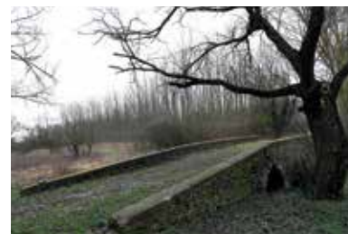
Szent Gotthárd-híd – Lelesz

A nem éppen apró, 70 méter hosszú és 5 méter széles 15. századi híd alig észrevehetően bújik meg a főút mellett. Jogosan merül fel a kérdés, hogy mit keres vajon itt, a semmi közepén? A híd akkor épült, amikor a Ticec még erre is folyt. A mederszabályozás utáni holtágak kiszáradtak, így a híd alatt manapság csupán bőséges esőzések vagy hóolvadás után találhatunk vizet. Szent Gotthárd szobrát a 18. században a szerzetesek helyezték ide, s a szent egyben a híd névadója is lett. Az elnevezése annak ellenére megmaradt, hogy a szobor csak 1948-ig állt eredeti helyén. A híd különlegessége, hogy még ma is használható, annyi korlátozással, hogy motoros gépjárművek nem hajthatnak fel rá.