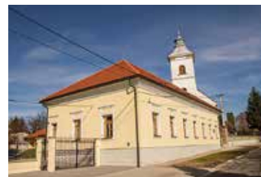
Múzeum Bibliie – Gönc

Nakoniec prichádzame k hlavnej atrakcii, „Biblickej výstavnej sieni“. Tu záujemcom s objavovaním výstavy pomôže interaktívna aplikácia. Nájdete tu nielen maďarčinu, ale aj iné jazykové a prekladové verzie svätého písma preložené do väčšiny svetových jazykov.