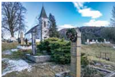
Református templom – Gönc

Nevével ellentétben a múzeum nem kizárólag a Biblia történetével foglalkozik. Többek között a Göncön tanult diákoknak, iskolamestereknek és neves prédikátoroknak állít emléket úgy, hogy közben bemutatja Gönc szellemi értékeit, illetve a gönci református közösség évszázados egyházművészeti kincseit. Mindemellett az egyházmegye és az egyházkerület relikviái is helyet kaptak a múzeum négy részéből álló kiállításán.