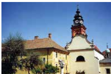
Pálós-piarista templom – Sátoraljaújhely

Az első feljegyzések a településről 904-ből valók, amelynek 1261-ben V. István adományozott városi rangot. Később II. Rákóczi Ferenc, Kazinczy Ferenc, Kossuth Lajos és Andrássy Gyula gróf formálták kultúráját, történelmét. A főteret az impozáns római katolikus templom uralja. Előtte, a Dörzsik-forrás díszes kútjának tetején, egy ismeretlen szobrászművész alkotása, a helyiek által csak Vasmancinak nevezett női szobor áll. Néhány lépéssel távolabb az ország egyik legnagyobb Kossuth-szoboregyüttese látható. A tér másik oldalán az egykori zempléni vármegyeháza (ma városháza) barokk stílusú épületét találjuk. Falai közt kapott helyet a Zempléni Levéltár. A főteret koraeklektikus házsor kíséri végig.