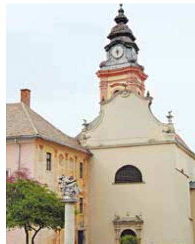
Pálós-piarista templom – Sátoraljaújhely

A Pálós-piarista templom és rendház Sátoraljaújhely egyik legrégebbi műemlékegyüttese, templomában gyönyörű barokk főoltár és stallumok teremtenek áhítatos hangulatot. Maga az épület, amely a remeteéletet a missziós munkával ötvöző pálos rend szellemiségét őrzi, középkori eredetű. Szent Egyed tiszteletére emelték, valószínűleg a 13. század második felében, később többször bővítették és átépítették. 1434-es elnevezésében már a Nagyboldogasszony név is szerepelt. Toronyórájának kőből faragott számlapján 1501-es évszámot olvashatunk, amely jelzi, hogy hajdanán az ország egyik legrégebbi órájának része volt. Az órákő ma a rendház kerengőjének folyósóján látható