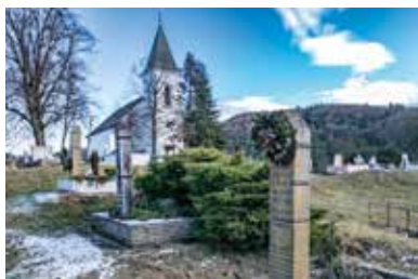
Reformovanej cirkvi – Gönc

Ďalšou časťou je „Cirkevná sála umenia“, ktorá prezentuje rekvizity náboženskej praxe, kde boli okrem rekvizít Göncu vystavené aj cirkevné rarity ostatných zborov v okolí. Je krásne vidieť, ako sa líšili techniky zdobenia a formy rôznych nominálnych hodnôt. Kompetentné oči dokázali na prvý