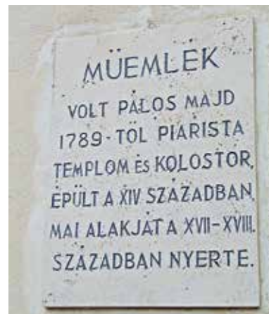
Nápis na kláštore

Piaristický kostol a kláštor Pálos je jednou z najstarších a najcennejších pamiatok v Sátoraljaújhely. Na stenách kláštora je možné vidieť architektonickú nástennú maľbu. Jeho gotický kostol má pietny barokový hlavný oltár a stánky. Kostol, ktorý zachováva ducha pavlínskeho rádu spájajúceho pustovnícky život s misionárskou prácou, je stredovekého pôvodu. Postavili ho na počesť sv. Egyeda pravdepodobne v druhej polovici 13. storočia a potom ho niekoľkokrát rozširovali. V roku 1434 už bol v jeho názve zahrnutý titul Nanebovzatia. Do kameňa vytesaný ciferník ich vežových hodín nesie letopočet 1501, čo znamená, že boli kedysi súčasťou jedných z najstarších strojových hodín v krajine. Zvon je viditeľný na chodbe kláštornej zvonice.