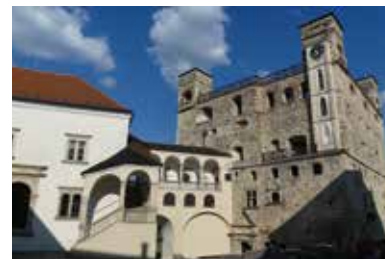
Rákóczi-vár – Sárospatak

Itt kéz a kézben jár a reneszánsz, a reformáció, a barokk, a romantika és a példátlan ütemben változó jelen. A már őskorban is lakott Sárospatakról az első írásos emlék még 904-ből származik. 1201-ben a település városi rangot kapott Imre királytól, amit később elveszített, majd évszázadok múltán újra elnyert. Sárospatak fő látványossága a Rákóczi-vár, de mivel állítólag itt született Szent Erzsébet, Sárospatakot világszerte elsősorban az Erzsébet-kultusz magyarországi központjaként ismerik. Sárospatak a reformáció és a reneszánsz magyarországi megjelenésének egyik alaphelyszíne. A híres és hírhedt Perényiek, Comenius, II. Rákóczi Ferenc vagy éppen Kossuth Lajos nevével lépten-nyomon találkozhatunk a város nevezetességeit járva.