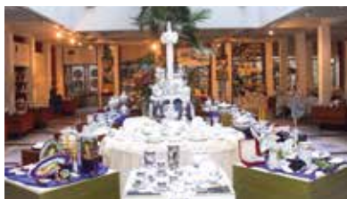
Porcelánmúzeum – Hollóháza

Bizonyára sokan láttak már olyan tányért, csészét vagy éppen kancsót, melynek alján egy festett holló ücsörgött, jelezve, hogy az a kerámia Hollóházán készült. Az 1777-től még csak üveghutaként működő manufaktúra (az ország legrégebbi folyamatosan működő üzeme) kőedény gyártó üzemé, majd modern porcelángyárrá nőtte ki magát, hírnevét s egyben munkahelyet szerezve a hollóházi lakosoknak. 1981-ben a művészet és az ipar szerencsés egybefonódása ösztökélte a gyár vezetőit, hogy egy kiállítást létrehozva megpróbálják megmenteni az utókor számára azt a sok művészi értéket, amely a gyárban mindeddig született. A tárlaton az üvegből, kerámiából, kőedényből és porcelánból készült használati- és dísz tárgyak időrendben sorakoznak, mint afféle tárgyi le nyomatai a gyár történetének. Nagy élményben lehet része annak, aki a gyárba is bejut, ott ugyanis közvetlenül tanulmányozhatja a porcelángyártás folyamatát. Akik kedvet kaptak ahhoz, hogy maguk is próbára tegyék eddig szunnyadó művészi tehetségüket, azok számára a múzeumban kialakítottak egy alkotóműhelyt, ahol bárki elkészítheti magának kézzel megformált porceláncsodáját.