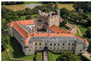
Hrad Rákócziho – Sárospatak

Prvá písomná zmienka o prehistorickom osídlení pochádza z roku 904. Už v roku 1201 získalo od kráľa Imreho štatút mesta, ktorý neskôr stratilo, potom sa stalo trhovým mestom a neskôr veľkou dedinou. Hlavnou atrakciou Sárospataku, bohatého na kultúrne a architektonické dedičstvo, je hrad Rákóczi, no keďže sa tu údajne narodila svätá Alžbeta, ochrankyňa chudobných, je Sárospatak vo svete známy aj ako maďarské centrum Alžbetin kult. Sárospatak je jedným z východísk reformácie a renesancie v Uhorsku. Pri štúdiu histórie mesta nájdeme aj mená slávneho rodu Perényiovcov, Komenského, ale aj Ferenca Rákóczyho a Lajosa Kossutha. Toto miesto je turistami obľúbené nielen kvôli historickým pamiatkam. Termálne kúpele, pivnice vynikajúcich vinárov, jazda na koni, zámoček potoka či morské oko vrchu Megyer sú mimoriadne atraktívnymi programami pre tých, ktorí sem prídu.