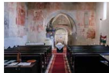
Református templom – Vizsoly