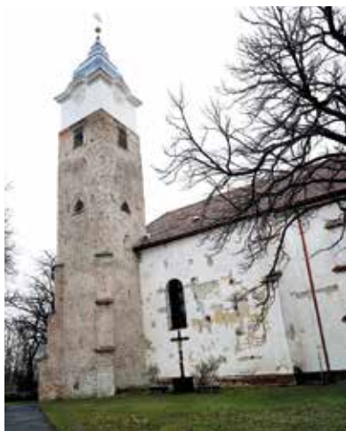
Premontrei kolostor – Lelesz

Boleszló váci püspök még III. Béla király uralkodása idején (1180-ban) alapította a leleszi apátságot, amely a térség legrégebbi, egyben legnagyobb monostora. A monumentális épületegyüttes valamelyest kiállta az idők próbáját, viszont az apátság Szent Kereszt tiszteletére emelt temploma a tatárjáráskor csaknem elpusztult. A tatárok elvonulása után szerencsére sikerült helyreállítani, és Lelesz továbbra is prépostság maradt. Később, a reformáció idején, a legkevésbé sem ügyeltek az építészeti stílusjegyek megőrzésére, de szerencsére a kolostor részét képező Szent Mihály kápolna 14. századi gótikus freskói fennmaradtak, így napjainkban újra láthatók. 1945 után a kolostorban me-