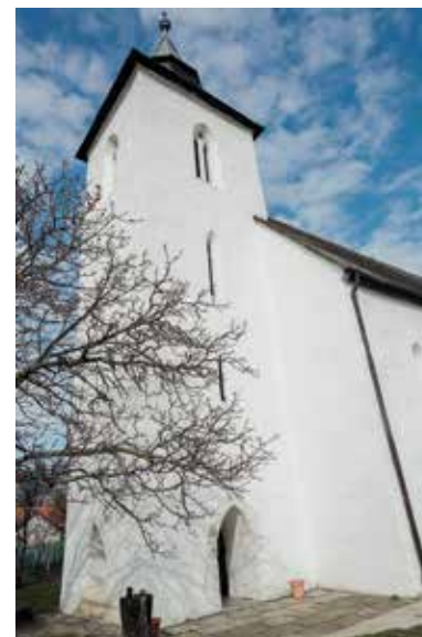
Reformovanej cirkvi – Vizoly

Táto viac ako 3000 rokov obývaná osada dostala poprednú úlohu, keďže je azda najznámejšou osadou v západnej časti Zemplínskych vrchov. Jeho význam v cirkevných dejinách je nepochybniteľný, nazýva sa aj ako Betlehem reformácie. Meno Vizoly sa najčastejšie vyskytuje v súvislosti s Bibliou. Prvýkrát v Uhorsku tu bola vytlačená Biblia celá preložená do maďarčiny. Naša prechádzka múzeom bude v tejto osade trvať dlhšie. Vo Vizoly sa oplatí stráviť celý deň, pretože okrem krásnych kostolov troch historických cierev, múzea histórie tlače, je tu aj geologická kuriozita.