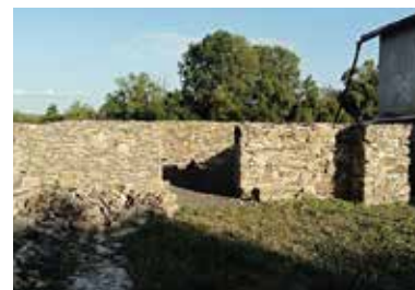
Minorita kolostor romjai – Rad