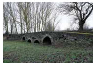
Most svätého Gottharda – Leles

Gotický most dlhý 70 metrov a široký 5 metrov je sotva badateľný. Deväťjamkový most je zrejme najpatinovannejším mostom v Karpatskej kotline. Vzdušia po regulácii koryta vyschli, a tak pri maximálnych zrážkach či náhlom topení snehu môžeme nájsť vodu pod mostom. Sochu svätého Gottharda sem umiestnili mnísi v 18. storočí a podľa mosta dostal svätec aj meno. Názov sa zachoval, ale socha zostala na mieste len do roku 1948. Zvláštnosťou mosta je, že napriek svojmu veku je stále použiteľný, len s toľkými obmedzeniami, že po ňom nemôžu prechádzať motorové vozidlá.