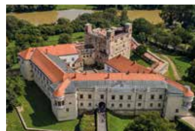
Rákóczi-vár – Sárospatak

Az egykori Pálóczi-várkastély nem a mai vár helyén állt, hanem a város északi határánál, de ez a 15. század húszas éveitől a főúri belviszályok okozta romlásban megsemmisült. A mai várkastély és a hozzá kapcsolódó város erődítései eredeti alakjukban 1534 és 1542 között épültek. A pataki birtok a 17. században a Rákóczi-család birtokába került. A vár, mely a magyar nemzeti örökség része, ekkor élte virágkorát, és vált a magyarországi késő reneszánsz építészet legértékesebb alkotásává, Sárospatak legjelentősebb műemlékévé.