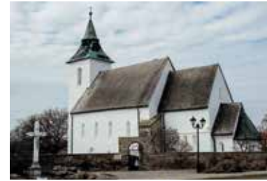
Református templom – Vizsoly

A 12. és 15. századból származó freskók a Bibliából és a magyar történelemből vett események közül ábrázolnak néhányat, így például Szent László királyunk egyik hőstettét. Az apszis képein Krisztus születésével kapcsolatos jeleneteket láthatunk, míg a szentély freskói a feltámadás és mennybemenetel pillanatait örökítik meg. További freskórészletek a Szent Kereszt megtalálásának jelenetét mutatják be, illetve jól kivehető a kissé elhalványult és sérült falra festett képeken Szent György viaskodása a sárkánnyal.