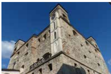
Hrad Rákócziho – Sárospatak

Niekdajší hrad Pálóczi nestál na mieste dnešného hradu, ale na severnej hranici mesta, no v dvadsiatych rokoch 15. storočia ho zničila skaza spôsobená vnútornou aristokraciou. Opevnenie dnešného hradu a k nemu pripojeného mesta bolo postavené v pôvodnej podobe v rokoch 1534 až 1542. O hrade Sárospatak, udalostiach, ktoré sa tu odohrali a ich národných účinkoch by som vedel rozprávať celé dni. Spočiatku hrad utrpel toľko rozbrojov, vojen a v neposlednom rade aj vlastníckych zmien, že do jeho histórie nahliadne a pochopí takmer len skúsený historik.