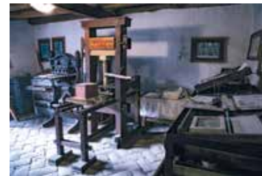
Múzeum histórie tlače – Vizoly

Táto viac ako 3000 rokov obývaná osada dostala poprednú úlohu, keďže je azda najznámejšou osadou v západnej časti Zemplínskych vrchov. Jeho význam v cirkevných dejinách je nepochybniteľný, nazýva sa aj ako Betlehem reformácie. Meno Vizoly sa najčastejšie vyskytuje v súvislosti s Bibliou. Prvýkrát v Uhorsku tu bola vytlačená Biblia celá preložená do maďarčiny. Naša prechádzka múzeom bude v tejto osade trvať dlhšie. Vo Vizoly sa oplatí stráviť celý deň, pretože okrem krásnych kostolov troch historických cierev, múzea histórie tlače, je tu aj geologická kuriozita.