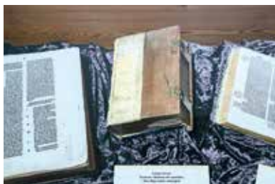
Múzeum Bibliie – Gönc

pohľad zistiť, do ktorej denominácie alebo z ktorej oblasti patril kňazský plášť, reverenda alebo predmet konkrétnej relikvie.