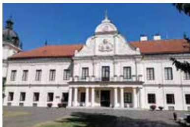
Andrassy-kastély – Töketerebes

A település már az újkőkorban is lakott volt. Első említése 1219-ből származik, ekkor még Terebus néven. Eredetileg a közeli Párics várának kiszolgálófaluja volt. A várat viszontagságos történelme során a Perényiektől Luxemburgi Zsigmondon át Thökölyig többen is uralták, végül a Habsburgok 1686-ban porig rombolták. Az egykori vár falának anyagát Töketerebes további építésére használták fel, sőt a Csákyaknak köszönhetően e vár falaiból épült meg a későbbi Andrassy-kastély alapépülete is. A falu legtragikusabb történelmi eseménye talán az volt, amikor az 1831-es kolerázadás során a katonasága a kaszával felfegyverzett parasztok közé lövetett. Töketerebes a földrengések, árvizek és tűzvészek ellenére mindig megújult, amelynek ma is álló tanúbizonysága a plébániatemplom.