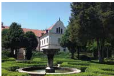
Andrassy-kastély a kert felől – Töketerebes

Töketerebesben találjuk az Andrassy-család historizáló klasszicista stílusban átalakított egykori kastélyát és az azt övező gyönyörű parkot.