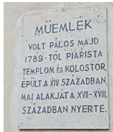
Tábla a kolostoron

A pálosok a Bocskai-felkelés idején elhagyták az újhelyi kolostort, így a templom pusztulásnak indult. Az épületet 1638-ban, a pálosok visszatérte után újjáépítették. 1660-ban Báthori Zsófia és fia, I. Rákóczi Ferenc itt tért át nyilvánosan a katolikus hitre, és ezt követően ők emeltették a Szent Kereszt mellékkápolnát, amelyet később, a Thököly-felkelés idején a kurucok többször is kifosztottak. 1786-ban II. József császár eltörölte a pálos rendet, ekkor került az épületegyüttes a piaristák tulajdonába. Ide járt elemi iskolába és gimnáziumba Kossuth Lajos.