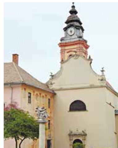
Paulínsky piaristický kostol – Sátoraljaújhely

Hlavné námestie zobrazuje obraz typického horského mesta. Lod'ovému alebo vretenovitému priestorovému systému dominuje impozantný rímskokatolícky kostol. Pred ňou je socha neznámeho umelca, pravdepodobne talianskeho, ktorá sa stala známou ako fontána Nymfa alebo Vasmanci. Z ozdobenej fontány pod sochou vyviera voda prameňa Förszik, ktorý sa kedysi používal na hasenie. O pár krokov ďalej sa týči najväčší súbor Kossuthovej sochy v Maďarsku s vyznaním vyrytým do kameňa na podstavci. Na druhej strane námestia stojí baroková budova bývalej Zemplínskej župy, dnes so Zemplínskym archívom, v ktorom sú zachované písomné pamiatky z 12. storočia. Hlavné námestie sprevádza rad raných eklektických domov, informujúcich tých, ktorí kráčajú pomaly, že Sátoraljaújhely je aj mestom terás. Toto viac ako 760-ročné mesto je plné atrakcií a zábavy. Okrem bohatstva architektonického a kultúrneho dedičstva priťahuje množstvo turistov aj nádherné prírodné prostredie a atrakcie medzinárodne uznávaného Zemplínskeho dobrodružného parku. Po prehliadke niektorých miestnych zaujímavostí sme sa vydali na „Alföldi Kéktúra“.