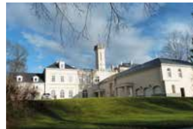
Kaštieľ Károlyi – Füzérradvány