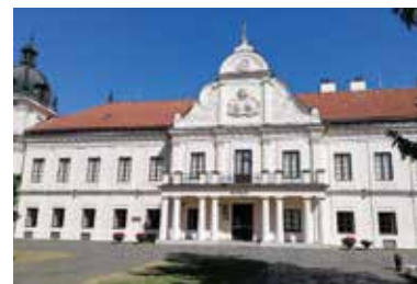
Hrad Andrásyovcov – Trebišov

Mesto bolo osídlené už v neolite. Prvá zmienka o Trebišova je známa ako Terebus z roku 1219 a bola pôvodne služobnou obcou neďalekého hradu Párics. Počas búrlivej histórie hradu vládli viacerí ľudia od Perényiho cez Žigmunda Luxemburského až po Thökölyho a napokon hrad v roku 1686 zbúrali Habsburgovci. Na ďalšiu výstavbu mesta bol použitý materiál múru bývalého hradu a zásluhou Csákyovcov bola z múrov tohto hradu postavená základná budova neskoršieho Andrásyho hradu. Azda najsmutnejšou historickou udalosťou Trebišova bolo, keď v roku 1831 bojovalo vojsko s členmi sedliackeho povstania na Zemplíne, známeho aj ako cholerové povstanie, vyzbrojené kosami, motykami a palicami. Napriek zemetraseniam, záplavám a požiarom sa mesto vždy dokázalo spamätať, o čom svedčí aj farský kostol.