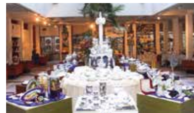
Múzeum porcelánu – Hollóháza

Na výstave sú v chronologickom poradí zoradené úžitkové a dekoratívne predmety zo skla v havranovom ráme, keramiky, kameniny a porcelánu ako druh hmotného odtlačku histórie. Môže to byť fantastický zážitok pre každého, kto vstúpi do továrne, kde môžete priamo zažiť proces výroby porcelánu od výroby foriem až po maľovanie. V múzeu je zriadená tvorivá dielňa, kde si každý môže vyrobiť svoj vlastný unikátny porcelánový predmet.