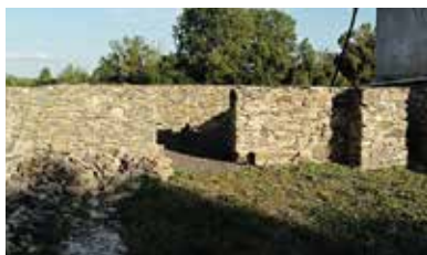
Kláštor Minorita – Rad

Prvá písomná zmienka pochádza z roku 1319. Vďaka rozsiahlym lúkam a hlinitej pôde, ktorá dobre ukladá vlahu, boli po stáročia hlavným zdrojom obživy dobytok a krmiwo. Hoci nie je bohatý na slávne historické udalosti, aj obec Rad mal hrad, o ktorom sa predpokladá, že bol zničený v kuruckých časoch. Obec mala toľko majiteľov, že by sa to ani nedalo spočítať.