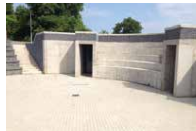
Rad pivníc Ungvár – Sátoraljaújhely