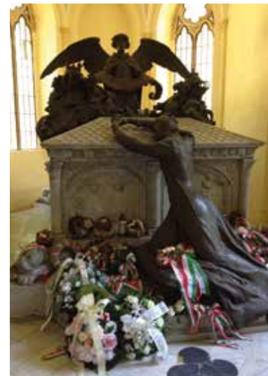
Andrássy-mauzóleum – Tőketerebes

A település már az újkőkorból is lakott volt. Első említése 1219-ből származik, ekkor még Terebus néven. Eredetileg a közeli Párics várának kiszolgálófaluja volt. A várat viszontagságos történelme során a Perényiektől Luxemburgi Zsigmondon át Thökölyig többen is uralták, végül a Habsburgok 1686-ban porig rombolták. Az egykori vár falának anyagát Tőketerebes további építésére használták fel, sőt a Csákyaknak köszönhetően e vár falaiból épült meg a későbbi Andrassy-kastély alapépülete is. A falu legtragikusabb történelmi eseménye talán az volt, amikor az 1831-es kolera-járvány során a katonaság a kaszával, kapával felfegyverzett parasztok közé lövetett. Tőketerebes a földrengések, árvizek és tűzvészek ellenére mindig megújult, amelynek ma is álló tanúbizonysága a plébániatemplom.