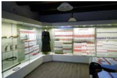
Bodroγκközi Múzeumporta – Cigánd

A Múzeumportán, amely mai formájában a korábbi falumúzeum kibővített intézményeként 2015-ben készült el, és amely megismertet Bodroγκköz múltjával, akár egy egész napot is eltölthetünk. A múzeumegyüttes a népművészet-től a helytörténeti és történelmi ismeretekig számtalan témakört ölel fel. A több épületből álló porta változatos egységeinek kiállításai modern muzeológiai és múzeum-pedagógiai módszertannal, valamint interaktív eszközökkel elevenítik fel a letűnt korok hajdan itt élt lakosainak életét, szokásait, teszik élővé Bodroγκköz hagyományait. Figyelemre méltó, hogy a helytörténeti tárlat egy-egy tablóján feltűnnek helyi, jeles, lokálpatrióta cigándiak, akik említésre méltó szerepet tölthettek vagy töltenek be a falu életében. A Múzeumporta ifjúsági- és kézműves nyári táborok, oktatási programok, színes rendezvények színtere. Múzeum-pedagógusai tárlatvezetése rendkívül színvonalas.