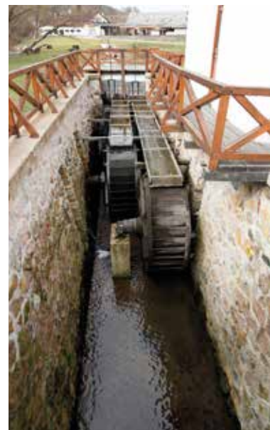
Vodný mlyn – Pálháza

Jeho rozvoj bol často zastavený, pretože najprv Turci, potom husiti a nakoniec mor a cholera zničili obyvateľstvo. V obciach Hegyköz, vrátane Pálházy, bol najvýznamnejším zdrojom príjmov les, no v 19. storočí aj neďaleký Károlyiho hrad zamestnával veľa sluhov a poľných robotníkov. V roku 1875 bola postavená píla na spracovanie vynikajúceho lesného dreva, vďaka čomu bola postavená prvá úzkorozchodná lesná železnica v Uhorsku, ktorá funguje dodnes.