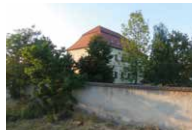
Solný úrad – Veľké Trakany