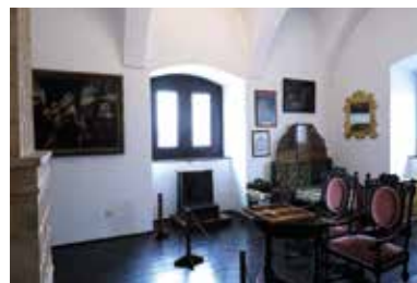
Mágócsy-kastély – Pácin

A reneszánsz épület története a 16. századra nyúlik vissza, ekkor emeltette nagybátyja támogatásával Mágócsy András. Pácin földrajzi elhelyezkedését tekintve zártabb régióban fekszik, nem volt nagyobb támadásoknak kitéve, ezért ellentétben más korabeli épületekkel – meg tudta őrizni viszonylagos épségét és rezidencia-jellegét. A kastély bejárata feletti címeres faragott kőben láthatjuk az építés pontos évszámát, az 1581-es esztendő. Az épület a történelmi Magyarország egyik legjobb állapotban fennmaradt reneszánsz kastélya, amely különleges építészeti- és művészettörténeti értékekkel bír, s a közép-európai reneszánsz művészet fontos emléke.