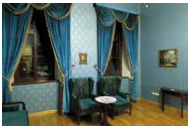
Sennyei-kastély – Bély

A bélyi kastélyt 1781-ben emeltette egy magát az Aba nemzetségből származtató família, a grófi rangra emelt Sennyei-család. Az eredetileg barokk kastély a későbbi átépítések során nyerte el jelenlegi rokokó–klasszicista stílusát. A kastély egy három épületből álló épületegyüttes, amely U-alakot formál. A központi épület főbejárata nyugati irányba néz, amelynek oldalain – külön építményként – épült a kastély északi, valamint déli szárnya. A 20. században az épületkomplexum több átalakításon és külföldre hasznosításokon esett át. Az 1990-es évek elejéig általános iskolaként, raktárként, szükséglakásként, illetve katonák részére szálláshelyként szolgált. A Szlovák Köztársaság Műemlékügyi Hivatala 1990-ben a Sennyei-kastélyt műemlékké nyilvánította. 2009-ben megkezdték központi épületének felújítását, valamint a teljes közművesítését. Az építkezési munkálatokat 2012 nyarán fejezték be. Ugyanabban az évben került sor a belső terek teljesen új, de a kastély letűnt fénykorát idéző bebútorozására.