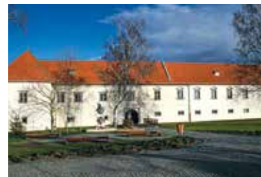
Kaštieľ Rákóczi – Borša

Rodná obec Ferenc Rákócziho. Kazinczy ho preto nazval „svätou spomienkou“. Známa história hradu Borsí sa začala v 16. storočí a archeologické vykopávky nenašli žiadne staršie múry. Po Lorántffyovcoch a od roku 1616 po sobášii so Zsuzsannou Lorántffy ho György I. Rákóczi prestaval na zámok úctyhodnej veľkosti, chránený širokou priekopou. Svojimi rozmermi ďaleko prevyšoval ostatné hrady Zemplén a Abaúj a veľkosťou a určite aj umeleckou výzdobou konkuroval hradu šťastia. Jeho najväčším lákadlom je, že Ferenc Rákócziho II. dňa 27.3.1676.