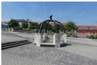
Namestie milénia – Kráľovský Chlmec

Kráľovský Chlmec je najväčšie mesto v Medzibodroží. Oplatí sa tu stráviť celý deň prehliadkou pamiatok mesta, ako je zámok vdovy po Györgym Rákóczim, Zsuzsanna Lorántffy alebo Námestie milénia pred úradom primátora. Kultúrne Centrum Medzibodrožia a Použia so sídlom v Kráľovskom Chlmcu bol založený v roku 2006 ako kultúrna inštitúcia košického kraja. Múzeum sídli v pamiatkovo chránenej budove bývalej Regulačnej vodárenskej spoločnosti Tisa.