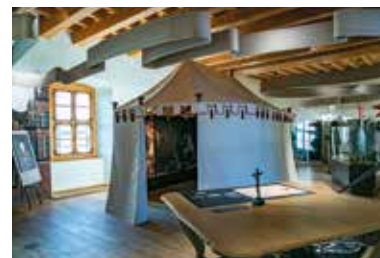
Kaštieľ Rákóczi – Borša