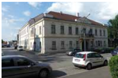
Múzeum Ferenc Kazinczyho – Sátoraljaújhely