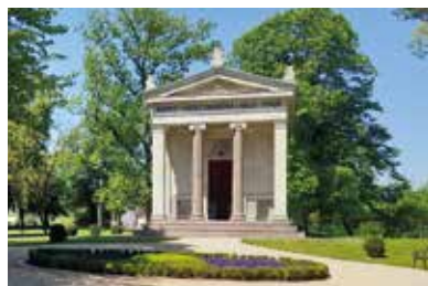
Kazinczyho pamätná sieň – Széphalom