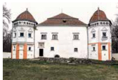
Mágócsy-kastély – Pácin

A szlovák–magyar határ mentén fekvő Pácin község Sátoraljaújhelytől, Sárospataktól, Kisvárdától és a szlovákiai Királyhelmectől is egyaránt 20-30 kilométerre található. A Mágócsy-kastély épületét erdős park és az úgynevezett Báró-kert veszi körül.