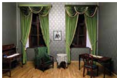
Kaštieľ Sennyei – Biel

Zámok Bélyi bol postavený v roku 1781 rodinou samotného rodu Aba – „rodinou Sennyei“, ktorá bola povýšená do grófskeho stavu. Zámok bol postavený v barokovom štýle a neskoršími prestavbami získal súčasný rokokovo-klasicistický štýl. Zámok je komplex troch budov, ktoré majú tvar písmena „U“. Hlavný vchod centrálnej budovy je orientovaný na západ, po oboch stranách ktorého boli severné a južné krídlo hradu postavené kolmo - ako samostatné stavby. V 20. storočí prešiel komplex budov viacerými úpravami a exploatáciami. Do začiatku 90. rokov slúžil ako základná škola, sklad, pohotovostný domov, ubytovanie pre vojakov. Po zmene režimu Pamiatkový úrad SR postupne vyhodnotil zvyšné objekty a v roku 1990 vyhlásil hrad Sennyei za pamiatku. V roku 2009 sa začala obnova centrálnej budovy hradu a verejné práce na hrade. Stavebné práce boli ukončené v júni 2012 a následne v októbri 2012 boli interiéry zariadené úplne novým nábytkom, ktorý pripomína časy rozkvetu hradu.