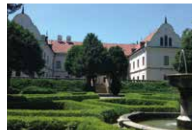
Hrad Andrassyovcov – Trebišov

Dnešný slovenský názov Hlavného mesta Zemplína je Trebišov. Prvá zmienka o ňom je z roku 1254 „Terebes“. Názov môže byť odvodený od slovanského osobného mena „Trebis“, ale môže zahŕňať aj slovanské sloveso „trebiti“ (= vykoreniť), predponu „kapitál“ možno názov rodiny.