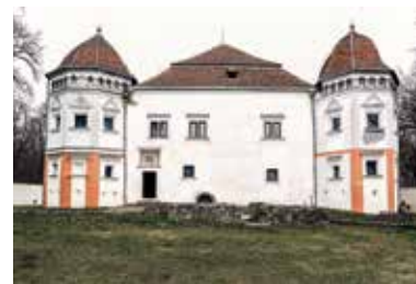
Palác Mágócsyovcov – Pácin

Obec Pácin, ležiaca na slovensko-maďarských hraniciach, je od Sátoraljaújhely, Sárospataku, Kiszvárdy a od hranice na Slovensku len 20-30 km. Okrem hradu sa tu nachádza lesopark a Báróova záhrada.