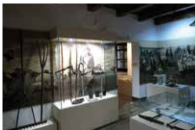
Múzejný prístav – Cigánd

Po príchode do Cigánd môžeme stráviť celý deň v Bodrogeközi Múzeumporta. V roku 2015 bola dokončená rozšírená inštitúcia bývalého dedinského múzea, ktorá poskytuje pohľad do minulosti Medzibodrožia: od ľudového umenia až po poznanie miestnej histórie, komplex múzea pokrýva množstvo tém. Expozície rôznorodých celkov prístavu približujú život a zvyky ľudí rôzneho veku pomocou modernej metodiky a interaktívnych nástrojov a ožívujú tradície Bodrogeközu. V suteréne domu Sőregi sa napríklad pomocou hravých inštruktážnych videí môžete naučiť najdôležitejšie kroky ľudového tanca regiónu. Pri bráne múzea sa môžete zoznámiť aj s gastronomickou tradíciou krajiny, ochutnať miestne jedlá a vyskúšať si ich prípravu, ako je drobnokrajný, zemiakový plamienok či lienka.