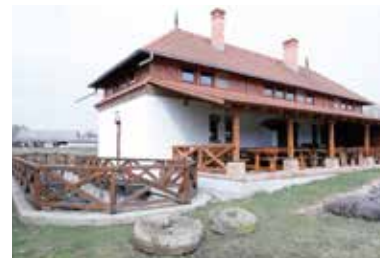
Vodný mlyn – Pálháza

Hoci ľudia žili v Pálháze už od praveku, až z roku 1389 sa zachovala prvá písomná zmienka o osade na stránkach do-načného listu. Od koho a čím bola osada pokrstená, nie je známe, no je pravdepodobné, že toto biblické meno dostal kedysi jeden z jej majiteľov. Súčasťou Füzérskeho panstva bola aj Pálháza.