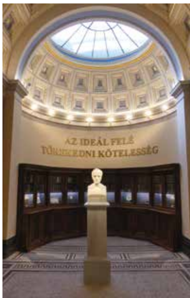
Kazinczy Emlécsarnok – Széphalom

Az Emlécsarnok Kazinczy Ferenc széphalmi házának helyén áll, ahol 1806-tól haláláig, 1831-ig élt családjával. Születésének centenáriumán (1859) az Akadémia egy „dícsarnok” építését kezdeményezte. Ybl Miklós és Szkalnitzky Antal tervezésében az Emlécsarnok 1873-ban készült el; 1876-tól fogad látogatókat. A klasszicista épület nem mauzóleum, hiszen Kazinczy a park sírkertjében nyugszik. Kezdetben az Emlécsarnokban csupán Pesky Józsefnek az íróról 1828-ban festett portréja volt látható. Az idők folyamán relikviákból és emléktárgyakból gazdag, kiállításra alkalmas gyűjtemény halmozódott fel. A Magyar Nyelv Múzeumának megnyitásával (2008) lehetőség nyílt arra, hogy oda kerüljön az életutát méltón bemutató tárlat, és az Emlécsarnok a kegyeleti feladatra fókuszálhasson. Ennek jegyében egy reprezentatív válogatást mutatunk be a Kazinczyról életében készült portrékból, illetve azok másolataiból. Ehhez csatlakozik a Kazinczy-centenárium alkalmából készített Orlai Petrich-kép Kazinczy és Kisfaludy Károly találkozásáról. A festmény emblematikusan összegezi Kazinczynak az irodalmi világban elért megbecsülését. Az író relikviáit korhű könyvek társaságában az apszisban álló, az Akadémia által 1897-ben készíttette üvegezett szekrényben helyeztük el. A bejáratnál jobbra és balra a térség vármegyéinek címerzászlói függenek, jelezve az író szülőföldjéhez való szoros kötődését.