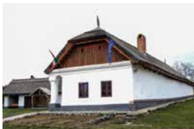
Múzejný prístav – Cigánd

„Múzejný súbor“ Múzejného prístavu Bodrogeköz (Bodrogeközi Múzeumporta), ktorý sa rozprestiera na obrovskej ploche, umožňuje nahliadnuť do minulosti mesta Cigánd a predstavuje aj históriu vývoja krajiny a tradície ľudového umenia. „V objatí riek Tisa – Bodrog – Latorca žil Cigánd po stáročia spolu s mnohými ďalšími osadami v Medzibodroží. Aj toto objatie bolo požehnaním, lebo držalo od nás Tatárov a Turkov, ale často sme museli trpieť prekypujúcou láskou, keď vstali z postele a navštívili krajiny a domy našich predkov.“