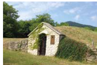
Rad pivníc Ungvár – Sátoraljaújhely

Žiadna z osád vo vinárskej oblasti nemá takú veľkú sieť pivníc na tak malom území. Pivničný rad je prístupný verejnosti, ale dolu do pivníc sa dá ísť len po predchádzajúcej dohode. Zo Sátoraljaújhely na Kazinczy Ferenc utca (hlavná ulica) 1 km severne od centra, vľavo, je rad pivníc, na spodné parkovisko sa dá dostať autom.