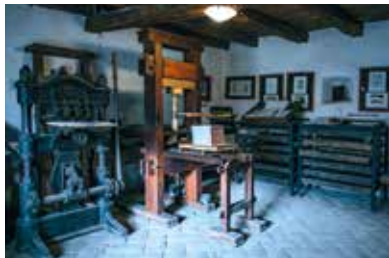
Vizsolyi Biblianyomtató Műhely

2017. október 31-re, a Műhely tervei szerint, elkészült 200 darab Vizsolyi Biblia , ami tökéletes másolata az eredeti könyvnek. Bekötését a többszáz éves, korabeli technikával készítette a restaurátor könyvkötőműhely, ami szintén Vizsolyban működik. A bibliákat egykoron kecskebőrbe kötötték. Mára nem létezik a 16. századi kikészítési technika, ezért Vizsolyban megkísérelték rekonstruálni a tímárok korabeli munkáját, így a felhasználni kívánt bőroket korhű cserző anyagokkal kezelik, készítik ki. Az utolsó, izgalmas és látványos munkafázis a bibliákat felöltöztető fém veretek elkészítése. A Műhely vezetői úgy gondolták, ha már szinte az egész munkafolyamat itt zajlik Vizsolyban, itt kell elvégezni a veretek öntését is. Megépítettek egy kisebb öntödét, így a bibliák megerősítésére és díszítésére szolgáló veretek már itt készülnek – az érdeklődő turisták szemé láttára.