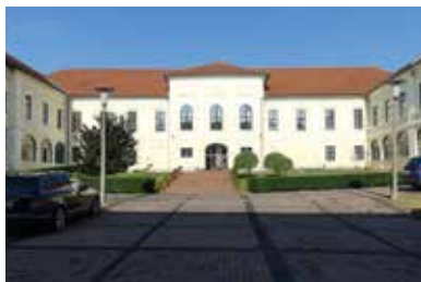
Radničný dvor – Sátoraljaújhely

Sátoraljaújhely spája tri regióny na mieste, kde sa stretávajú Bodrogek, Hegyköz a Hegyalja. V srdci hlavného námestia v tvare vretena sa nachádza rímskokatolícky kostol a tvár centra mesta stále odhaľuje jeho založenie nemeckými osadníkmi. Mesto sužoval aj tatársky vpád a náboženské boje. Sátoraljaújhely má množstvo pamiatok pre milovníkov kultúrnych hodnôt, môžeme sa vydať po stopách Rákócziovcov, objaviť dielo veľkého jazykového inovátora Ferenc Kazinczyho a obdivovať stopy reformnej architektúry v budove radnice. Okrem toho krásna krajina Zemplénska a vinárska oblasť na severnom konci Hegyalje poskytujú návštevníkom trvalý zážitok.