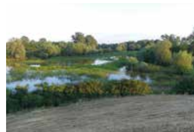
Tisza holtága – Nagytárkány