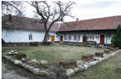
Vizsolyi Biblianyomtató Műhely

A református múzeum épületével szemben található a magánkézben lévő Vizsolyi Biblianyomtató Műhely és Élmény-múzeum. Új, de korhű látványt mutató nyomdagépen betűszedéssel, itt születnek a Vizsolyi Biblia faksimile kiadásai. Nem csupán a nyomtatás, hanem már az ahhoz szükséges speciális papír is hiteles módon, egy 16. századi technikával működő, vízimalom meghajtású papírmanufaktúrában, merítéssel készül.