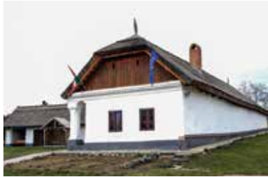
Bodroγκközi Múzeumporta – Cigánd

Cigánd 2004 óta város, a település egyben Bodroγκköz egyik központja is. A cigándi Bodroγκközi Múzeumporta hatalmas területen végig nyúló skanzenszerű múzeumegyüttes, mely bemutatja a táj alakulásának történetét, illetve a környék népművészeti hagyományait.