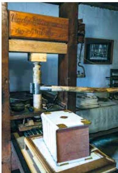
Dielňa na tlač Biblie Vizsolyi

Do 31. októbra 2017 bude dokončených 200 Biblií Vizsolyi, ktoré sú dokonalou kópiou pôvodných kníh. Prepojenie so súčasnou technikou robí reštaurátor kníhviazač, ktorý pôsobí aj vo Vizsoly. Originály kníh boli viazané do kozej kože. Vtedajšia dokončovacia technika už neexistuje, a tak bola zrekonštruovaná súčasná garbiarska dielňa a na úpravu potrebných koží používame súčasné garbiarske materiály. Poslednou časťou práce je výroba armatúr. Ak takmer celý proces prebieha tu vo Vizsoly, nechýba ani odlievanie tvaroviek. Postavila sa zlievareň a pred hosťami sa tu už pripravujú potrebné armatúry.