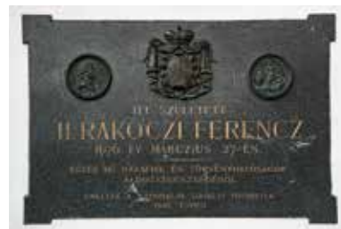
Rákóczi-kastély – Borsi

A kastély a szlovák oldalon, Sátoraljaújhelytől alig 5 kilométerre található. Egyes falai ugyan már IV. Béla király idejében is álltak, de eredetileg, 1579 körül, Zeleméri Kamarás István tokaji várkapitány emelte. I. Rákóczi György fejedelem 40 év múlva építtette át pompás várkastéllyá. A borsi kastély a magyar reneszánsz építészet egyik gyöngyszeme. A 2020-as igényes felújítást követően az épület megnyitotta kapuit, és immáron méltó állapotban, méltó környezetben, a fejedelem korát megidéző új kiállítással, rendezvényekkel, valamint szállodarészleggel, étteremmel és borkóstolóval várja látogatóit, a magyar történelem és kultúra iránt érdeklődő turistákat