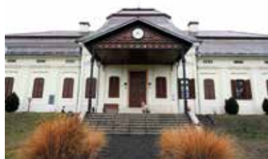
Kaštieľ Sennyei – Biel

Dnes možno Biel v Zemplínskej župe považovať za predmestie Čiernej nad Tisou, jeho slovenský názov je Biel '. Jeho prvá známa zmienka v podobe „Beyle“ sa nachádza v listine o opätovnom založení kláštora rádu Premontrei z Lelesu, ktorý sa našiel II. Ondrej v roku 1214.