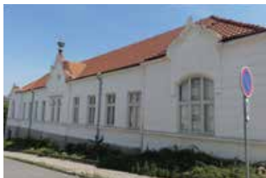
Regionális Mailáth József Múzeumi Tárlat – Királyhelmece