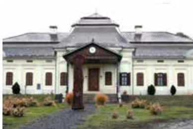
Sennyei-kastély – Bély