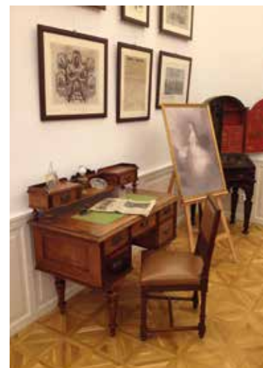
Hrad Andrassyovcov – Trebišov

Pokiaľ ide o názov Teresbesbes, niekoľko poznámok vysvetľuje toto: „teresbes“ znamená vyhladenie; a „kapitál“ je niečo z XIV. storočia, akoby sa rodina tohto mena objavila na viacerých miestach v kraji, a teda „hlavné mesto“ môže znamenať „zničenie hlavného mesta“.