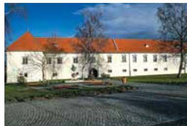
Rákóczi-kastély – Borsi

A történelmi Zemplén vármegyei Borsi II. Rákóczi Ferenc fejedelem szülőfaluja. Kazinczy a helyet egykor „szent emlékezetű”-nek nevezte. A megerősített épület méreteiben jóval meghaladta Zemplén és Abauj többi várkastélyát, gazdagságában pedig a szerencsi várral vetekedett. Legnagyobb nevezetessége, hogy 1676. március 27-én itt született II. Rákóczi Ferenc, a későbbi fejedelem.