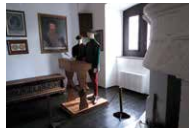
Palác Mágócsyovcov – Pácin