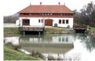
Sütőház – Pálháza