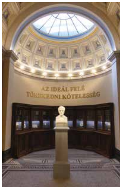
Kazinczyho pamätná sieň – Széphalom

Pamätná sieň stojí na mieste domu Ferenca Kazinczyho v meste Széphalom, kde žil so svojou rodinou od roku 1806 až do svojej smrti v roku 1831. Pamätná sieň, ktorú navrhli Miklós Ybl a Antal Szkalnitzky, bola dokončená v roku 1873 a od roku 1876 víta návštevníkov. Klasicistická budova nie je mauzóleum, keďže Kazinczy odpočíva na cintoríne v parku. Spočiatku bol v Pamätnej sieni vystavený len Kazinczyho portrét, ktorý v roku 1828 namaľoval József Pesky. Postupom času sa nahromadila bohatá zbierka pamiatok a suvenírov, ktorá sa zmenila na expozíciu. Otvorením Múzea maďarského jazyka (2008) bolo možné usporiadať výstavu o Kazinczyho živote. V duchu toho uvádzame reprezentatívny výber portrétov zhotovených ešte počas Kazinczyho života, ako aj ich kópie. K tomu sa pripája snímka Orlai Petricha o stretnutí Kazinczyho a Károlya Kisfaludyho, ktorá bola urobená pri príležitosti Kazinczyho storočnice. Obraz sumarizuje Kazinczyho ocenenie v literárnom svete. Spisovateľove relikvie boli uložené v sprievode súčasných kníh v presklenej skrini v apside, ktorú vyrobila Akadémia v roku 1897. Napravo a naľavo od vchodu visia vlajky žúp regiónu, čo naznačuje úzky vzťah spisovateľa k jeho vlasti.