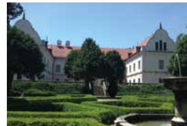
Andrássy-kastély – Tőketerebes

A település már az újkőkorból is lakott volt. Első említése 1219-ből származik, ekkor még Terebus néven. Eredetileg a közeli Párics várának kiszolgálófaluja volt. A várat viszontagságos történelme során a Perényiektől Luxemburgi Zsigmondon át Thökölyig többen is uralták, végül a Habsburgok 1686-ban porig rombolták. Az egykori vár falának anyagát Tőketerebes további építésére használták fel, sőt a Csákyaknak köszönhetően e vár falaiból épült meg a későbbi Andrassy-kastély alapépülete is. A falu legtragikusabb történelmi eseménye talán az volt, amikor az 1831-es kolera-járvány során a katonaság a kaszával, kapával felfegyverzett parasztok közé lövetett. Tőketerebes a földrengések, árvizek és tűzvészek ellenére mindig megújult, amelynek ma is álló tanúbizonysága a plébániatemplom.