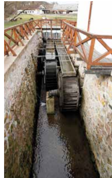
Vízimalom – Pálháza

Pálházáról 1389-ből maradt ránk írásos emlék. Nem tudni, hogy a települést pontosan kiről keresztelheték el, de valószínű, hogy egykor valamelyik tulajdonosát illethették e bibliai névvel. Pálháza a füzéri uradalom része volt. A falu élete bővelkedett történelmi tragédiákban; előbb a törökök, majd a husziták, végül a pestis és a kolera pusztították el a lakosság legnagyobb részét. A Hegyköz falvaiban, így Pálházán is, a legfontosabb jövedelemforrás az erdő volt, bár a 19. században a közeli Károlyi-kastély is számos munkaerőt, főként szolgálat és terepmunkásokat foglalkoztatott. 1875-ben Pálházán a kitűnő minőségű erdei faanyag feldolgozására fűrészmalmot építettek, ahová Magyarország első, és azóta is működő, keskeny nyomtávú, erdei kisvasútja szállította a nyersanyagot. A fakitermelés és a bányászat egyre gyarapodó településsé tette Pálházát, így a nagyközség 2005-ben városi rangot kapott. A turisták szolgálatába állított, egykori kisvasút Pálháza központjából indul kanyargós, árnyas útjára, s miután elhalad a rekonstruált középkori vízimalom mellett, rövid időre megáll, hogy megnézhessük az erdészeti múzeumot. Tovább haladva a patak nyomvonalát követve, Kőkapun át Rostallóra ér.