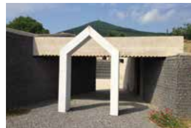
Ungvár Pincesor – Sátoraljaújhely