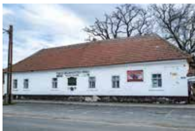
Dielňa na tlač Biblie Vizsolyi