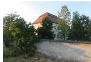
Sóház – Nagytárkány

A falu gyalogosan is bejárható: célpontunk a Tisza holtágánál fekvő Sóház. A 18. század első felében épült késő barokk stílusú Sóház évszázadokon át üzemelt. Az akkor még a Tisza partján álló hivatal és raktárépület a folyón szállított máramarosi só lerakó- és elosztóhelye volt. A Tisza szabályozása miatt fekvése és szerepe lassan megváltozott, az épület pusztulásnak indult. 2005-ben újították fel, falai között ma múzeum működik, amelynek kiállításán a pásztorok mesteriségével, a sóbányászattal, a Tisza-menti sószállító útvonallal, a község és a vidék néprajzával és helyrajzával ismerkedhet meg a látogató. A Sóháznak nincs állandó tárlatvezetője, vagy nyitvatartása; érkezés előtt érdemes telefonon érdeklődni.