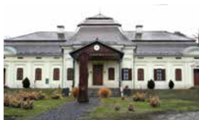
Kaštieľ Sennyeyovcov – Biel