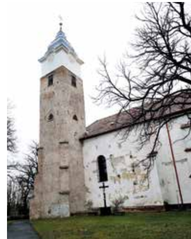
Premontrei kolostor – Lelesz

A települést 1142 körül alapították, első templomát Szent Keresztről nevezték el. A ma is álló prépostságot a premontreiek 1356-ban emelték. A helység 1369-ben még faluként, egy 1431-ben kiadott oklevélben már mezővárosként szerepelt. Nagy Lajos és Zsigmond királyok idején országos vásárok színhelye volt, 1405 körül pedig a Csicseri-család szegényházát és kórházát is létesített itt. A helység a középkorban kiemelkedő szerepet játszott nem csupán Zemplén vármegye, de Magyarország történetében is. Leleszen alapították meg a premontrei szerzetesrend Szent Kereszt prépostságát, amely egyházi és közigazgatási központ is volt. A premontrei rend eredetileg Szent Norbert nevéhez fűződik, aki a hozzá csatlakozó, apostoli életre törekvő papokat Prémontreban telepítette le. Az első szerzetesek 1121 karácsonyán tették le fogadalmukat. A rend tagjai a szigorú szerzetesi élet mellett lelkipásztori tevékenységet is folytathattak, és így plébániákat is szervezhettek és vezethettek. Az oklevelek tanúsága szerint a leleszi monostor templomában is végeztek ilyen szolgálatokat. Lelesz úgynevezett hiteles helyként okleveleket állított ki az Árpád-korban. A leleszi konvent levéltára talán okleveles emlékeink egyik leggazdagabb tárháza. Hiteles helyi jogát a 13. század második felében nyerhette el és 1567-ig meg is tartotta.