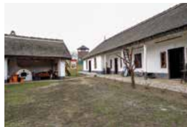
Múzeumporta – Cigánd

A 2004-ben városi rangra emelkedett Cigánd nevének eredete a mai napig nem tisztázott megnyugtatóan. Első írásos emléke egy 1289-ben kelt oklevél, amelyben a település még Zygand néven szerepel. A település határában 14 régészeti lelőhelyet is feltártak, ahol késő bronzkori falu maradványaira bukkantak, valamint kelta telepések néhány házának alapját is megtalálták. Gazdag leletanyaghoz jutottak egy 13. századi Árpád-kori pákásztanya feltárasakor is, amikor karámok, élelemtároló vermek, sőt lakóházak maradványai kerültek elő. Cigánd viszonylagos elszigeteltségének az 1994-ben átadott II. Rákóczi Ferenc híd vetett véget, hiszen az összeköti a települést a Tisza túloldalán lévő falvakkal.