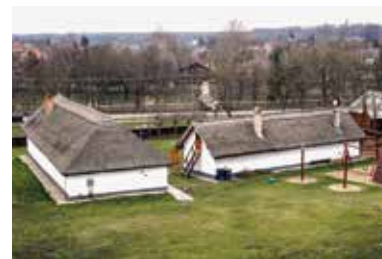
Múzejný komplex Bodrogközi Múzeumporta – Cigánd

Múzejný komplex Bodrogközi Múzeumporta, ktorý sa rozprestiera na obrovskej ploche, umožňuje nahliadnúť do minulosti mesta Cigánd a predstavuje aj históriu vývoja krajiny a tradície ľudového umenia. „V objatí riek Tisa – Bodrog – Latorca žil Cigánd po mnoho storočí spolu s mnohými ďalšími osadami v Bodrogu. Aj toto objatie bolo požehnaním, pretože Tatárov a Turkov od nás oddaľovalo, no často muse-li trpieť prekypujúcou láskou, keď vstali z postele a navštívili krajiny a domy našich predkov“ - čítajte na stránke mesto Gypsy ( http://cigand.hu/ ), kde môže každý zbohatnúť a získať aktuálne informácie.