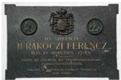
Rákóczi-emléktábla – Borsi

A kastélyt az elmúlt évszázadok alatt többször is átépítették, funkcióját tekintve valaha félig erőd, félig lakókastély volt. Történelmi jelentőségét a véletlennek köszönheti. I. Rákóczi Ferenc felesége, Zrínyi Ilona, aki eredetileg Kassára igyekezett, hogy leendő gyermekének ott adjon életet, kénytelen volt Borsiban megállni, mivel a szülés korábban megindult. Így esett, hogy II. Rákóczi Ferenc, a későbbi fejedelem, ebben a kastélyban látta meg a napvilágot, 1676. március 27-én. Az épület 2020-as felújítása óta újra méltó állapotban várja a fejedelem tisztelőit, turistákat, érdeklődőket. A múzeumból a fejedelem korát bemutató új, pazar kiállítással, a szálloda és étterem pedig minőségi szállással és borkóstolókkal hívogatja a Borsira betérő vendégeket.