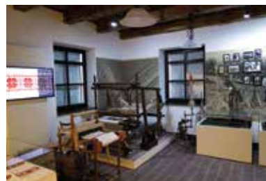
Múzeumporta – Cigánd

A Bodroközi Múzeumporta egy igazi skanzen, amely akkor a területet foglal el, mintha egy külön kis falu lenne a városban. A folyamatosan bővülő településtörténeti park valaha ténylegesen használatban volt népi, illetve paraszt-polgári tárgyak, berendezések segítségével mutatja be Cigánd múltját, népművészeti hagyományait, ugyanakkor átfogó képet nyújt az évszázadok során a Bodroközben történt geológiai változásokról, sőt a táj alakulásáról is. Ez a hely nem csak múzeumként, hanem rendezvényhelyszínként, táborok színtereként és helyi közösségi találkozóhelyként is üzemel.