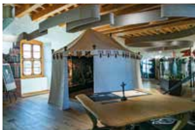
Kaštieľ Rákóczi – Borša