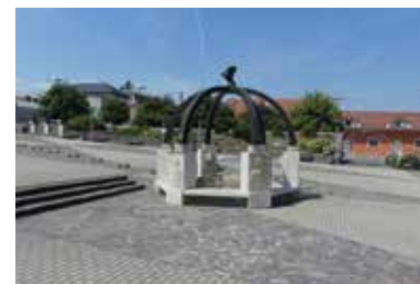
Námestie milénia – Kráľovský Chlmec