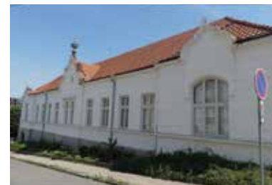
Regionálna muzeálna expozícia Jozefa Mailátha – Kráľovský Chlmec

Kráľovský Chlmec je najväčšie mesto v Medzibodroží. Oplátiť sa tu stráviť celý deň návštevou pamiatok mesta, ako je zámok vdovy po Györgym Rákóczim, Zsuzsanny Lorántffyovej alebo Námestie milénia pred mestským úradom. Kultúrne Centrum Medzibodrožia a Použia so sídlom v Kráľovskom Chlmcu vznikol v roku 2006 ako kultúrna inštitúcia Košickej župy. Múzeum sídli v pamiatkovo chránenej budove bývalej Regulačnej vodárenskej spoločnosti Tisa.