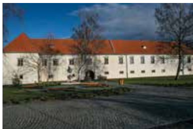
Rákóczi-kastély – Borsi

A történeti Zemplén vármegye Borsi települése, II. Rákóczi Ferenc szülőfaluja. Kazinczy a helyet „szent emlékeztű”-nek nevezte. Az eredeti várépület egyes falait még IV. Béla idejében húzták fel. A kastély a reneszánsz építészeti gyöngyszemének számít. Kiterjedt alagútrendszeréről az a hír járta, hogy olyan szélesre vájták, hogy két lovasszekér is elfért benne egymás mellett, amelyekkel a föld alatt Sátoraljaújhelyen át egészen Sárospatakig el lehetett jutni.