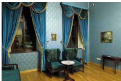
Sennyey-kastély – Bély