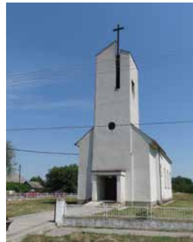
Katolikus templom – Bodrogszentmária