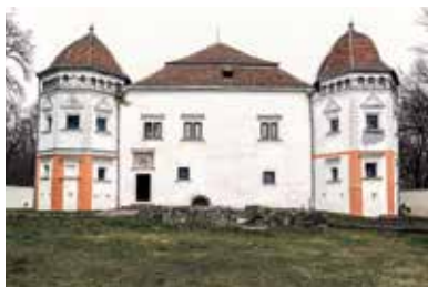
Mágócsy-kastély – Pácin