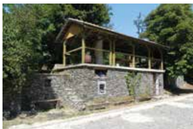
Vinné pivnice – Malý Horeš