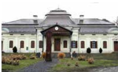
Sennyey-kastély – Bély