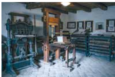
Vizsolyi Biblianyomtató Műhely