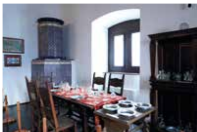
Mágócsy-kastély – Pácin