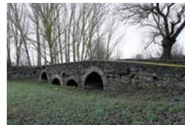
Szent Gotthárd-híd – Lelesz

A települést 1142 körül alapították, első templomát Szent Keresztről nevezték el. A ma is álló prépostságot a premontreiek 1356-ban emelték. A helység 1369-ben még faluként, egy 1431-ben kiadott oklevélben már mezővárosként szerepelt. Nagy Lajos és Zsigmond királyok idején országos vásárok színhelye volt, 1405 körül pedig a Csicseri-család szegényházát és kórházát is létesített itt. A helység a középkorban kiemelkedő szerepet játszott nem csupán Zemplén vármegye, de Magyarország történetében is. Leleszen alapították meg a premontrei szerzetesrend Szent Kereszt prépostságát, amely egyházi és közigazgatási központ is volt. A premontrei rend eredetileg Szent Norbert nevéhez fűződik, aki a hozzá csatlakozó, apostoli életre törekvő papokat Prémontreban telepítette le. Az első szerzetesek 1121 karácsonyán tették le fogadalmukat. A rend tagjai a szigorú szerzetesi élet mellett lelkipásztori tevékenységet is folytathattak, és így plébániákat is szervezhettek és vezethettek. Az oklevelek tanúsága szerint a leleszi monostor templomában is végeztek ilyen szolgálatokat. Lelesz úgynevezett hiteles helyként okleveleket állított ki az Árpád-korban. A leleszi konvent levéltára talán okleveles emlékeink egyik leggazdagabb tárháza. Hiteles helyi jogát a 13. század második felében nyerhette el és 1567-ig meg is tartotta.