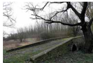
Most svätého Gottharda – Leles