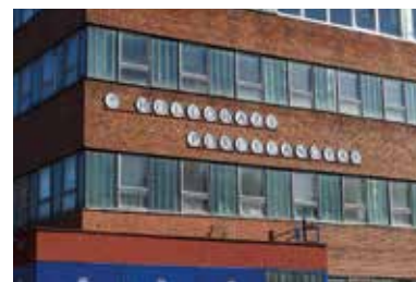
Porcelán továreň – Hollóháza