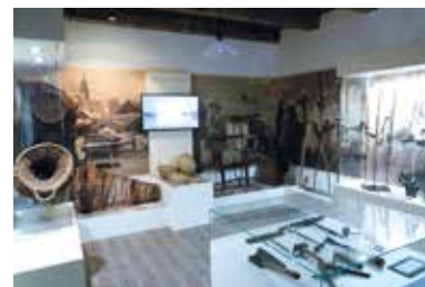
Múzejný komplex Bodrogközi Múzeumporta – Cigánd

V Múzejnom prístave Bodrogközi Múzeumporta môžeme spoznať tradície regiónu, slávnych Cigánov i samotné maďarské Medzibodrožie, ktorého centrom je Cigánd, ktorý je od roku 2004 mestom.