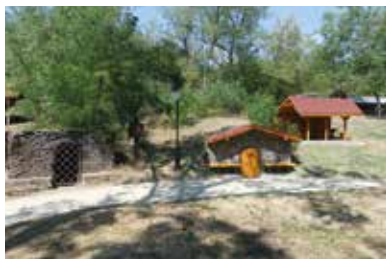
Pincesor – Kisgéres

Kisgéres határában található a kisgéresi pincesor, amely a környék egyik legnagyobb vulkáni tufába vájt pinceegyüttese, 83 önálló pincebejárattal, 364 ággal. Itt érlelik és tárolják boraikat a helyi borászok. A térségben a Polyhos Szőlészek és Borászok Társulása csapatának munkája szép példája a helyi közösségi összetartás, a tenni akarás és szakmai kreativitás eredményességének. 2015-ben hozták létre egyesületüket, amelynek jelenleg 27 borász tagja van. A Társulás már a megalakulás évében 11 rendezvényt szervezett, 2022-re 15 programot vett tervbe, amelynek több, mint a felét már meg is valósította. A tagok olyan célokat tűztek ki maguk elé, amelyek nemcsak Kisgéres, hanem az egész Bodrogtörzék gyarapodását, fejlődését szolgálhatják. Ezek között szerepel a szőlészet megújítása, a helyi szőlőfajták védelme, a borászat fellendítése, a szakmaiság növelése, a hagyományok megőrzése, a gasztroturizmus népszerűsítése és a borkultúra ápolása.