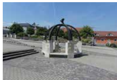
Millennium tér – Királyhelmecec

A múzeum a Bodrogköz és az Ung vidék kulturális örökségének gyűjtőhelye. Állandó tárlata Mailáth József grófnak állít emléket, aki több szalon kötődik a városhoz. A Bodrogközben hitel- és fogyasztási szövetkezeti hálózatot hozott létre, Királyhelmececen kórházat építtetett. Felesége tevékenysége nyomán alakult meg a Bodrogközi Nőegylet, amely rendkívüli szerepet vállalt a szegények és az iskolák segélyezésében. A Közművelődési Intézet, multikulturális szerepét betöltve, a kultúra ápolásának és a közművelődés fejlesztésének jegyében térségi múzeumot és könyvtárat is működtet.