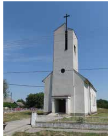
Katolícky kostol – Svätá Mária