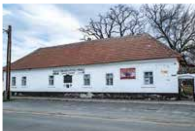
Zázitkové múzeum Bibliotlače Vizsolyi