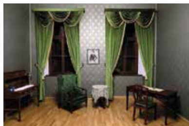
Kaštieľ Sennyeyovcov – Biel

Zámok v Bieli bol postavený v roku 1781 rodinou z rodu Aba – „rodina Sennyey“, ktorá bola povýšená do grófskeho stavu. Zámok, postavený v barokovom štýle, získal počas neskorších prestavieb súčasný rokokovo-klasicistický štýl. Zámok je komplex troch budov, ktoré majú tvar písmena „U“. Hlavný vchod centrálnej budovy je orientovaný na západ, po oboch stranách ktorého boli severné a južné krídlo hradu postavené kolmo - ako samostatné stavby. V 20. storočí prešiel komplex budov viacerými úpravami a exploatáciami. Do začiatku 90. rokov slúžila ako základná škola, sklad, núdzové bývanie, ubytovanie pre vojakov. Po zmene režimu Pamiatkový úrad SR postupne vyhodnotil zvyšné objekty a v roku 1990 vyhlásil hrad Sennyey za pamiatku. V roku 2009 sa začala obnova centrálnej budovy hradu a verejné práce na hrade. Stavebné práce boli ukončené v júni 2012 a v októbri 2012 boli interiéry zrekonštruované úplne novým nábytkom, ktorý pripomínal zašlú éru hradu.