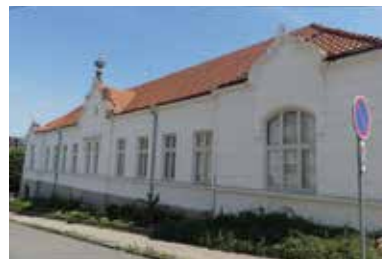
Regionális Mailáth József Múzeumi Tárlat – Királyhelmecec