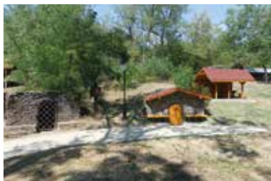
Vinné pivnice – Malý Horeš

Práca tímu Polyhos je dobrým príkladom vôle robiť, kreativity a užitočnosti miestnej spolupráce. Združenie vinohradníkov a vinárov v Malom Horeši bolo založené v roku 2015 a v súčasnosti má 27 členov. Už v roku svojho vzniku bolo zorganizovaných 11 podujatí, tento rok je naplánovaných 15 podujatí, z ktorých viac ako polovica je už zrealizovaná. Vinári z Horeša si stanovili ciele, ktoré môžu slúžiť vzostupu nielen Malého Horeša, ale celého Medzibodrožia. Ide o obnovu vinohradníctva, revitalizáciu vinárstva, zvýšenie profesionality, zachovávanie tradícií, propagácia gastroturizmu a pestovanie kultúry vína.