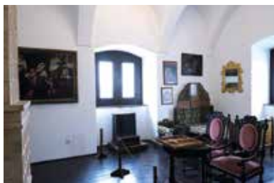
Mágócsy-kastély – Pácin