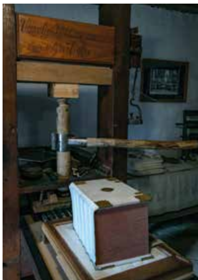
Zázitkové múzeum Bibliotlače Vizsolyi

Do 31. októbra 2017 bude dokončených 200 Biblií Vizsolyi, ktoré sú dokonalou kópiou originálnych kníh. Súčasnou technikou spojenie robí reštaurátor kníhviazač, ktorý pôsobí aj vo Vizsoly. Originály kníh boli viazané do kožej kože. Vtedajšia technika konečnej úpravy už neexistuje, takže súčasná garbiareň bola zrekonštruovaná a potrebné kože sa vyrábajú z vtedajších garbiarskych materiálov. Poslednou časťou práce je výroba armatúr. Keď tu vo Vizsoly prebieha takmer celý proces, je tu aj kasting. Postavila sa zlievareň a pred hosťami sa tu už pripravujú potrebné armatúry.