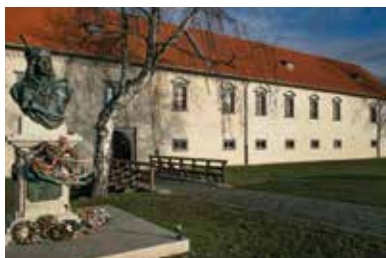
Kaštieľ Rákóczi – Borša